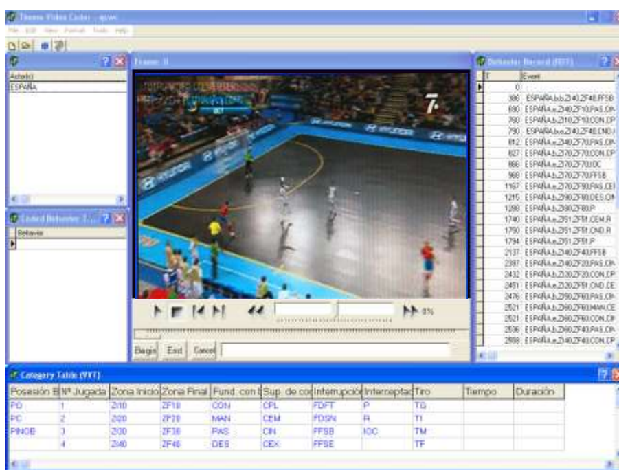
Figura 3. Captura del instrumento de registro ThemeCoder (Elaboración propia).

Así, como instrumento de registro se ha recurrido al programa ThemeCoder en el que se han introducido los nombres de cada uno de los criterios del instrumento de observación elaborado, así como los códigos relativos a las categorías correspondientes -Figura 3-. Según Bakeman (1978), el tipo de datos utilizados han sido tiempo-base y concurrentes, es decir, tipo IV.