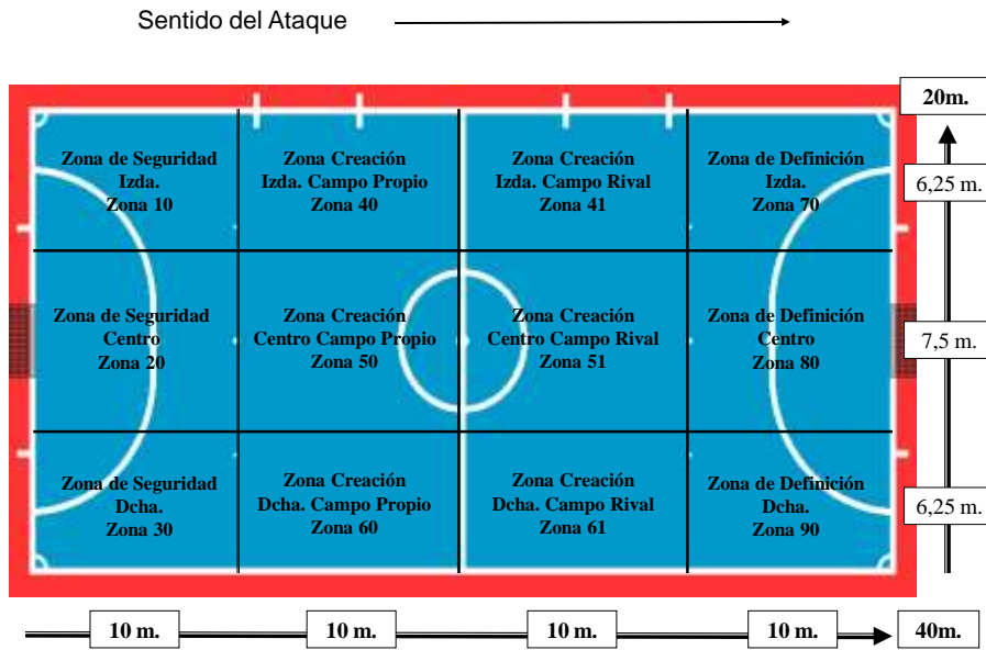
Figura 1. Distribución zonal del terreno de juego (Lapresa et al., 2013).

Además, para analizar la profundidad del juego se han fusionado las zonas del terreno de juego en sentido transversal para obtener cuatro sectores -véase figura 2-, a partir de Arana, Lapresa, Garzón y Álvarez (2004):