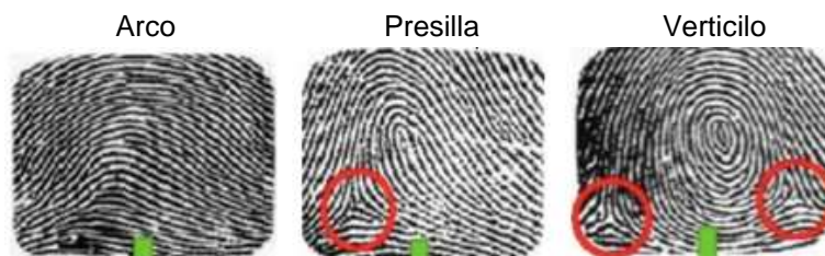
Figura 2. Dermatoglifos dactilares