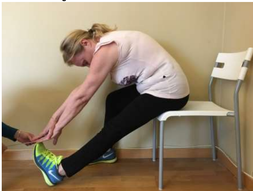
Figura 2. Test de flexibilidad chair sit and reach .

Para comprobación de la naturaleza de los datos fueron aplicados los tests de normalidad de Kolmogorov-Smirnov y de esfericidad de Mauchly. Después de verificados los datos se utilizó el análisis de varianza (ANOVA) de medidas repetidas, que es un test robusto ante las desviaciones (Díaz, 2009; Prieto y Herranz, 2010). Para la identificación de posibles diferencias significativas existentes entre las medias se aplicó el test post hoc Tukey (HSD). Los datos fueron analizados a través del programa informático SPSS 20.0, utilizando un nivel de confianza de 95 percentil (alfa de 0,05).